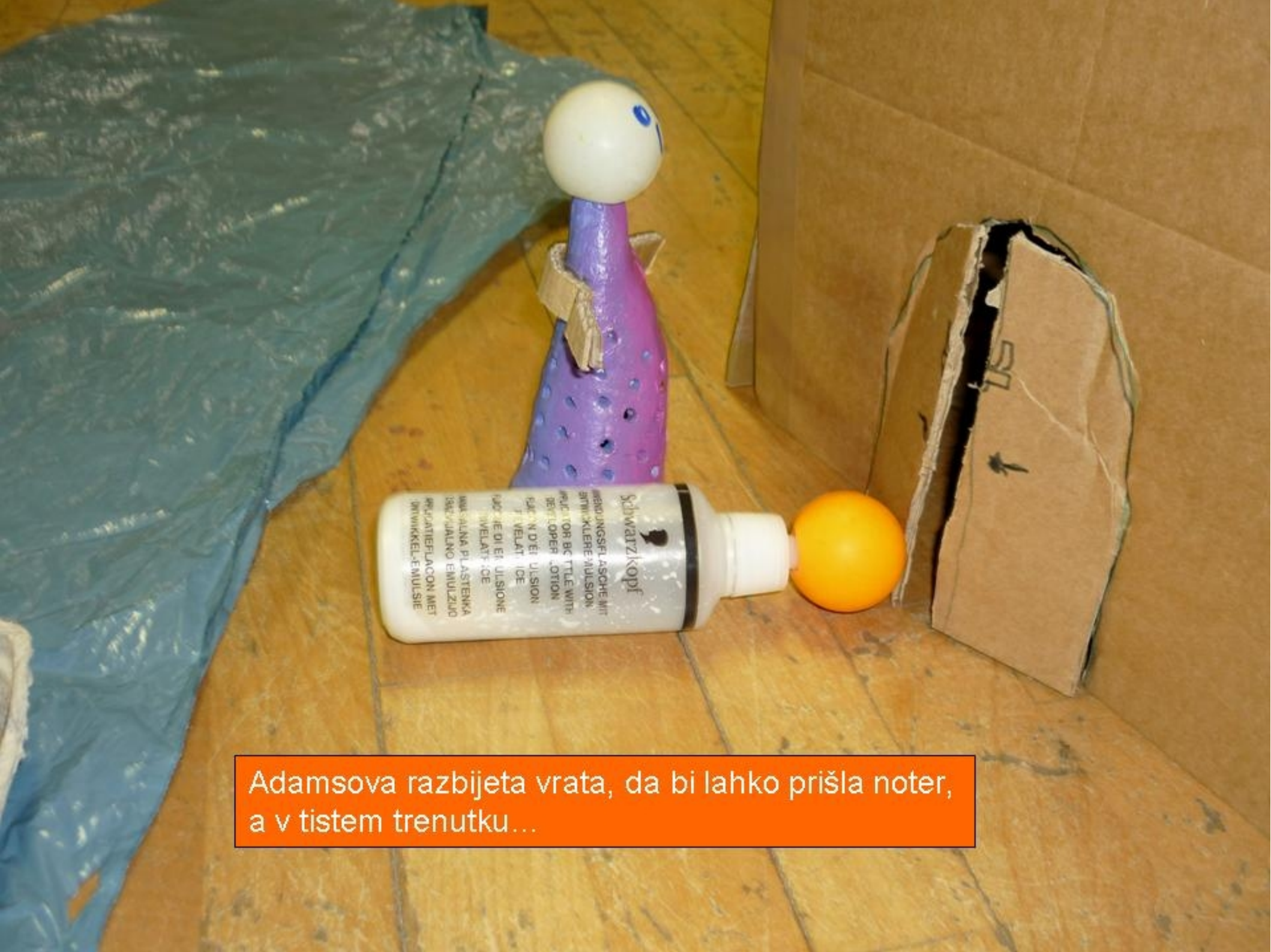
Adamsova razbijeta vrata, da bi lahko prišla noter, a v tistem trenutku...